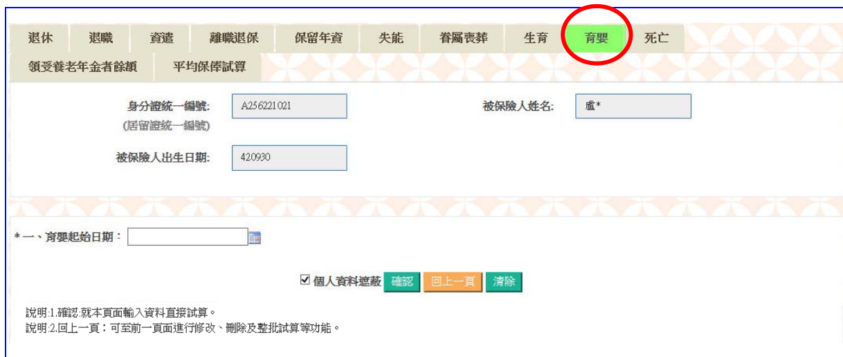
【圖 4-14】育嬰留職停薪津貼試算資料登錄畫面