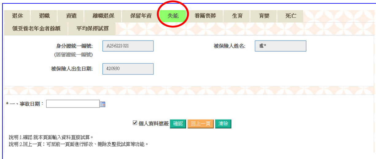
【圖 4-11】失能給付試算資料登錄畫面