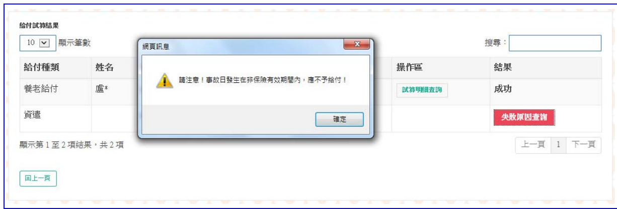
【圖 4-6】保險給付整批試算失敗原因畫面