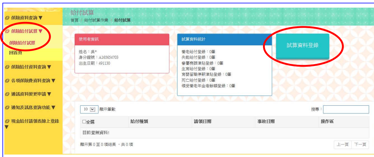
【圖 4-1】保險給付試算資料登錄作業畫面

登入系統首頁→展開保險給付試算選單→點選保險給付試算按鈕→進入給付試算作業畫面。